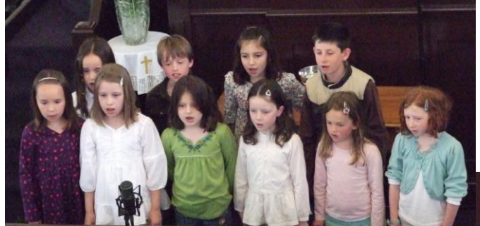
Dydd Sul y gwasanaeth "Felly Carodd" yn

Do bu'n hen gyfnod bach 'bishi' ym Methlehem - Canu Corws yr Haleliwia, Cyngerdd Codi'r To, Bedydd, Priodas, Cyfarfod â meddyg BanglaCymru, Swper Haf a llawer mwy. Dyma rai atgofion o'r cyfnod – a diolch i bawb fu'n weithgar,